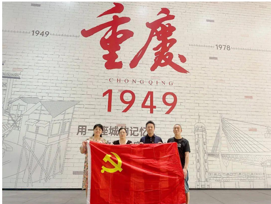
市拍协党支部组织党员观看大型情景剧《重庆•1949》

“同志们，如果明天就要上刑场，你的信仰会不会动摇？”当舞台灯光瞬间熄灭，演员一声振聋发聩的叩问在重庆 1949 大剧院回荡，重庆拍协党支部全体党员也一起屏住了呼吸。8 月 26 日下午，协会党支部把本月主题党日活动安排到《重庆•1949》的红色剧场，与 70 多年前的红岩英烈们来了一场跨越时空的对话。